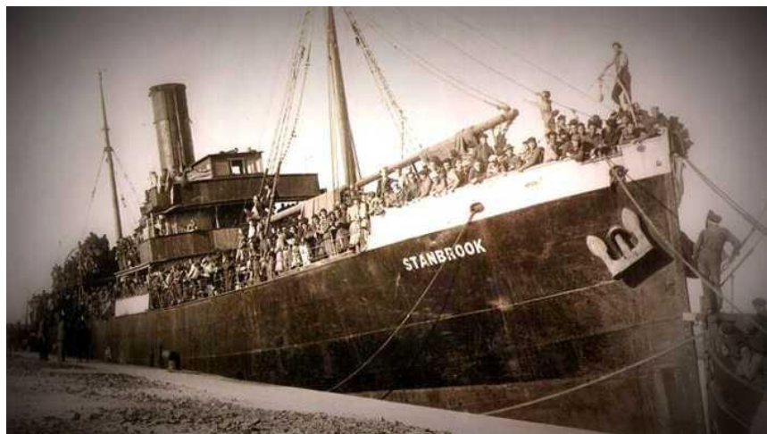
El buque carbonero británico “Stanbrook”. Foto tomada por autor desconocido en el puerto de Orán

Ésta se inicia en últimos días de la guerra civil tras la caída de Cataluña en manos de las tropas de Franco. La República tiene los días contados y, en esos dramáticos días finales de la guerra (marzo del 39), los puertos del Mediterráneo, especialmente el de Alicante, se convirtieron en la última esperanza de los republicanos para encontrar barcos y poder escapar de la represión.