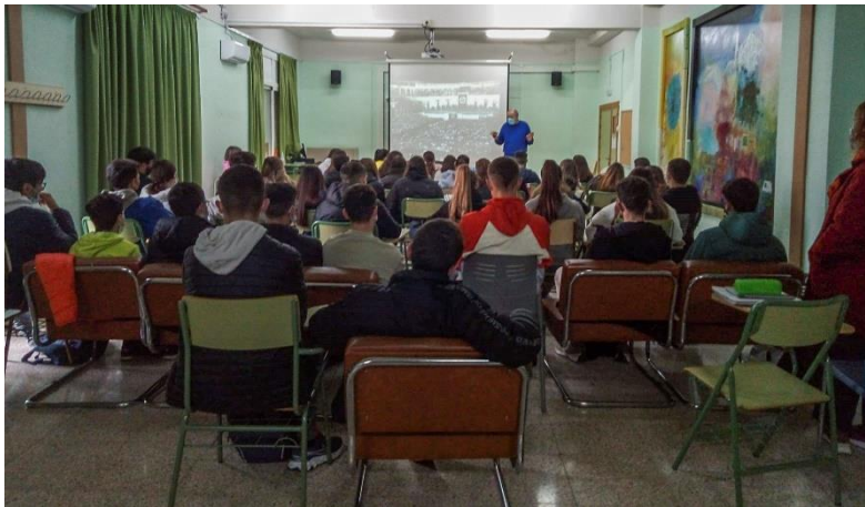
Charla en el IES Los Albares de Cieza (Murcia).

La charla se ha impartido, generalmente, en salones de actos reuniendo varios grupos. En algunos centros que no disponen de salón de actos se ha impartido en la biblioteca, gimnasio o aulas. En otros centros se ha impartido al grupo en su aula y otros grupos se han conectado en directo a través de internet. Donde no había posibilidad de reunir varios grupos en un espacio la charla se ha repetido en la aulas, en varias ocasiones en la misma mañana.