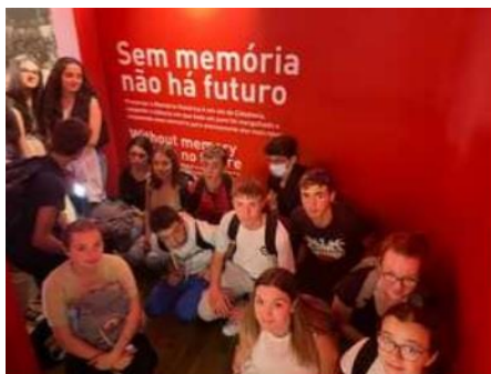
Museu do Aljube - Resistência e Liberdade

Durante los intercambios, el alumnado pudo conocer de primera mano aquellos lugares de memoria sobre los que habían investigado en el aula: Museo de Aljube en Lisboa, el Campo de Gurs en Olorón, el Fuerte-Prisión de San Cristóbal-Ezkaba o el Parque de la Memoria de Sartaguda (Navarra). Además, tuvieron el privilegio de asistir a los trabajos de exhumación de una fosa común en Berriozar, lo que, sin duda, impactó emocionalmente a estudiantes y profesores.