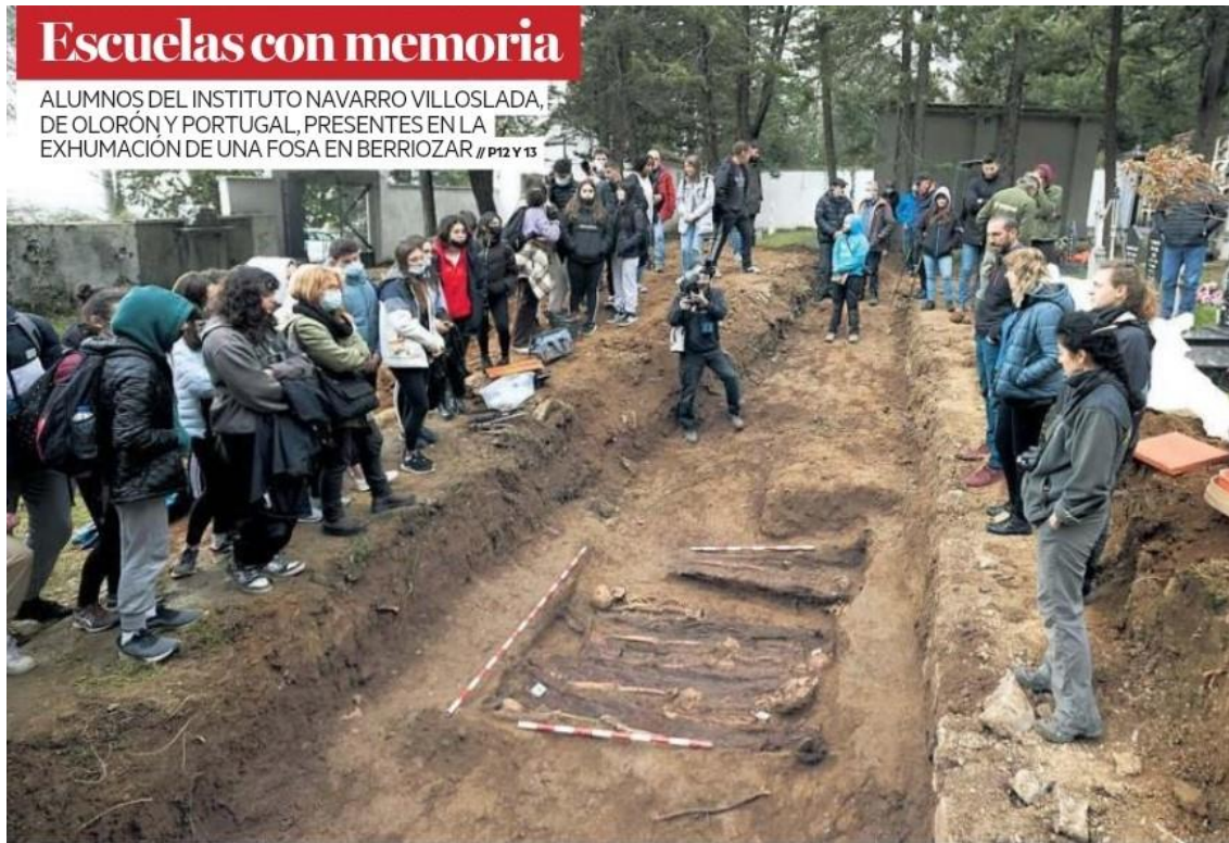
Los chavales observan los restos exhumados en una fosa común que podrían corresponder a presos del Fuerte Ezkaba.