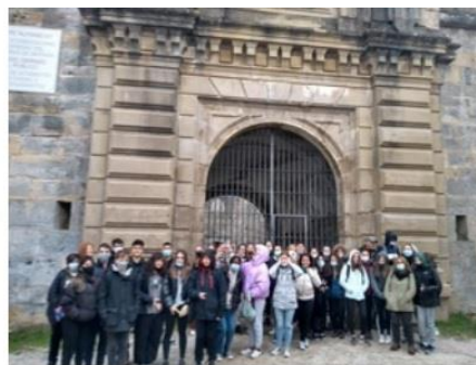
Fuerte-prisión de San Cristóbal-Ezkaba