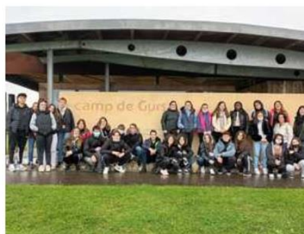
Campo de Gurs