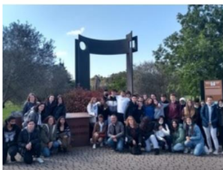
Parque de la Memoria-Sartaguda