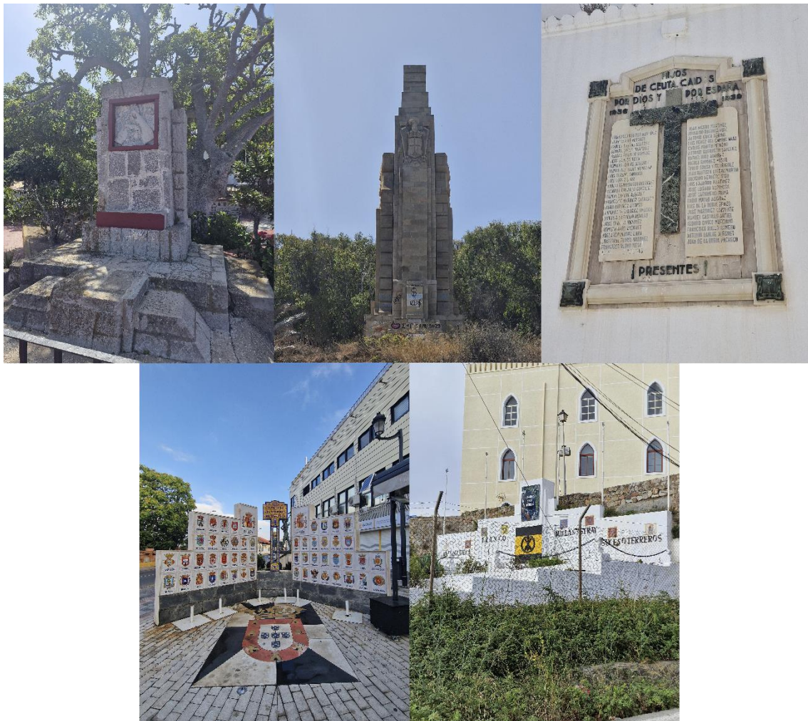
Imagen 2. Mosaico de las diferentes paradas del itinerario didáctico “‘Todo ha quedado atado...’ y sigue atado”. De izquierda a derecha en la parte superior: Monumento al Convoy de la Victoria, Monolito de Llano Amarillo, Lápida a los caídos por Dios y por España; parte inferior: Glorieta del teniente Reinoso y mural en Acuartelamiento Serrallo-Recarga del Tercio Duque de Alba 2º de La Legión.

uno del artículo treinta y cinco de la Ley de Memoria Histórica, y que por otra parte la Comandancia General de Ceuta responde ante esta alegación con la negativa a retirar u ocultar por iniciativa propia los nombres del pedestal 32 .