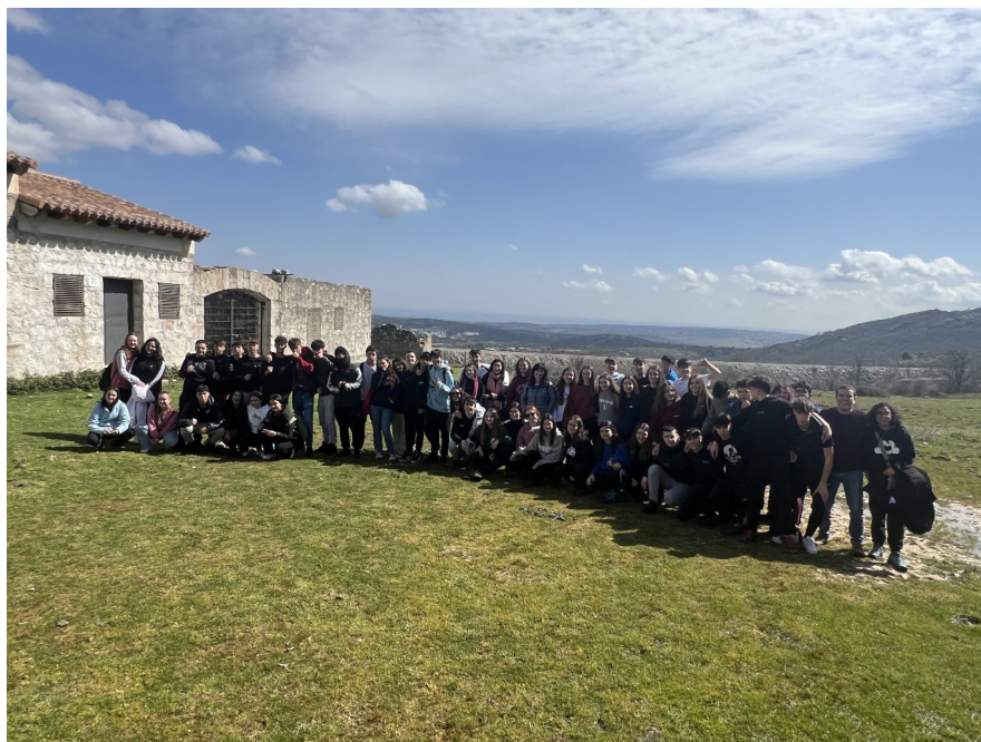
Visita al Destacamento de Bustarviejo. Alumnado del IES La Cabrera e IES Alaitz

La ruta del frente del agua es uno de los escenarios iniciales de la Guerra Civil española, y se encuentra próxima a la localidad madrileña de Paredes de Buitrago. Al ser detenido el avance hacia Madrid del coronel García Escámez en los alrededores de Buitrago del Lozoya, éste decide virar hacia el este para hacerse con el control de los embalses que abastecían de agua a Madrid, los de Puentes Viejas y el Villar, produciéndose intensos combates en la zona al lo largo del mes de agosto de 1936.