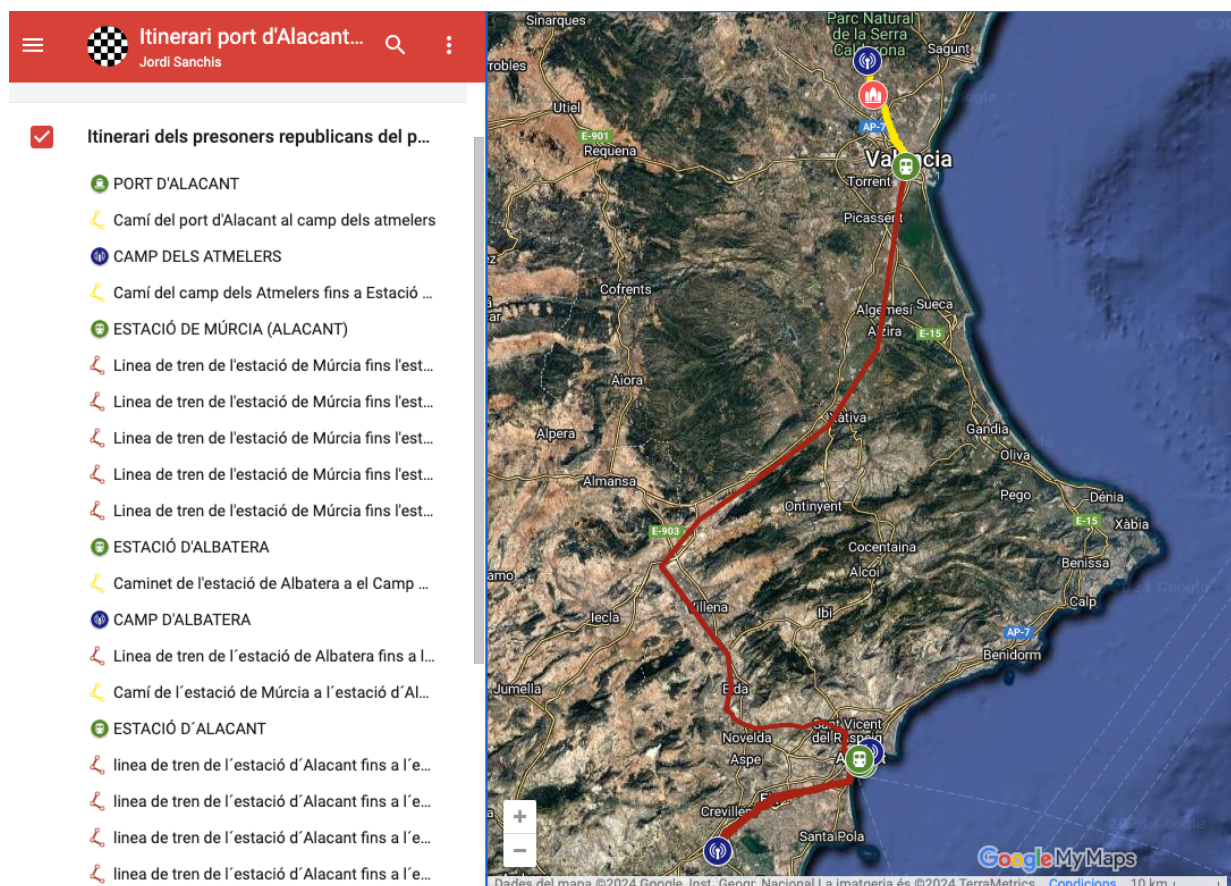
Imagen 1. Itinerario desde el puerto de Alicante al campo de concentración de Portaceli.

La primera tarea tenía como objetivo la creación de un documento cartográfico digital e interactivo usando la aplicación Google My Maps . A partir de los datos estudiados, principalmente en el documental y el libro de Rafael Arnal, los alumnos realizaron el itinerario que siguieron los prisioneros republicanos desde el puerto de Alicante al campo de concentración de Portaceli, situado en la localidad de Serra (València). En la versión digital 6 el mapa se puede ampliar o reducir, lo cual es muy útil sobretodo para observar los primeros traslados por la ciudad y provincia de Alicante. Se utilizaron marcadores para localizar el puerto, las estaciones de tren y los campos de concentración por donde son llevados los prisioneros. Cada uno de estos marcadores aparece con símbolos y colores específicos, así como con una fotografía de la época y una breve descripción realizada por los alumnos. Así mismo, se distinguen con colores diferentes los itinerarios realizados en tren o a pie por los presos.