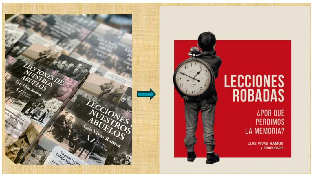
Portada de los dos libros del proyecto “Libros con Memoria”.

Con la publicación del libro Lecciones robadas. Por qué perdimos la Memoria , completamos el proyecto que hemos denominado “LIBROS CON MEMORIA”, que comenzó con la experiencia educativa de Lecciones de nuestros abuelos , convertido en libro en 2021, y que ya pudimos presentar en el anterior congreso de Pamplona, celebrado en 2022.