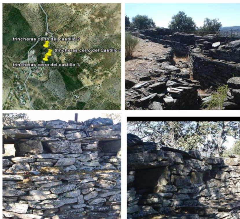
Fig. 2.1 Trincheras de Pozoblanco

sumido en un escenario de destrucción y caos, dejando una profunda huella en su historia y en la memoria de sus habitantes.