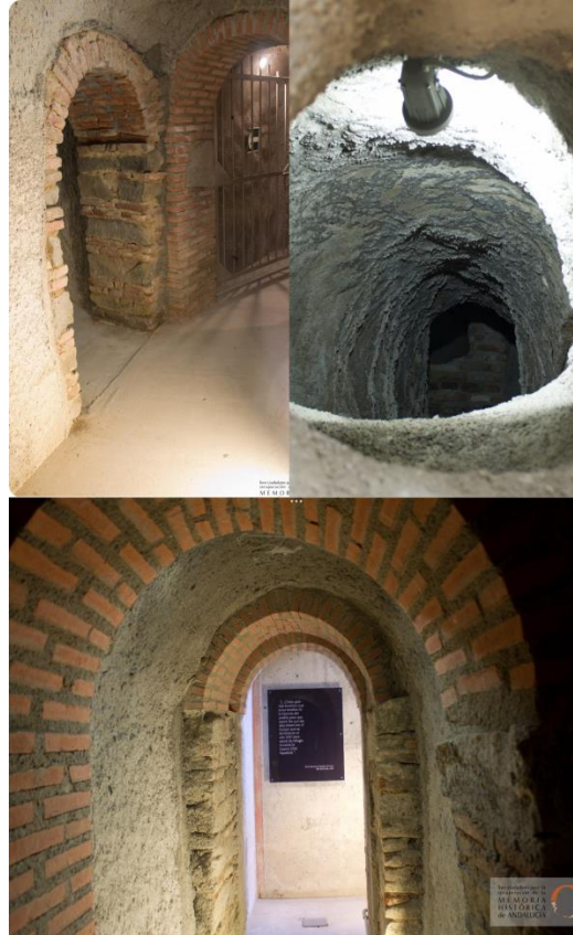
Fig. 1.1. Refugio de El Viso

Los refugios contra bombardeos aéreos fueron construidos, la mayoría de las veces, por los mismos habitantes de los pueblos. Colaborando activamente en su realización, bien fuera en lugares públicos como la plaza del pueblo o en refugios particulares de pequeño tamaño, habilitando para ello los espacios de las casas que consideraban más seguros, como las corrales de los cerdos.