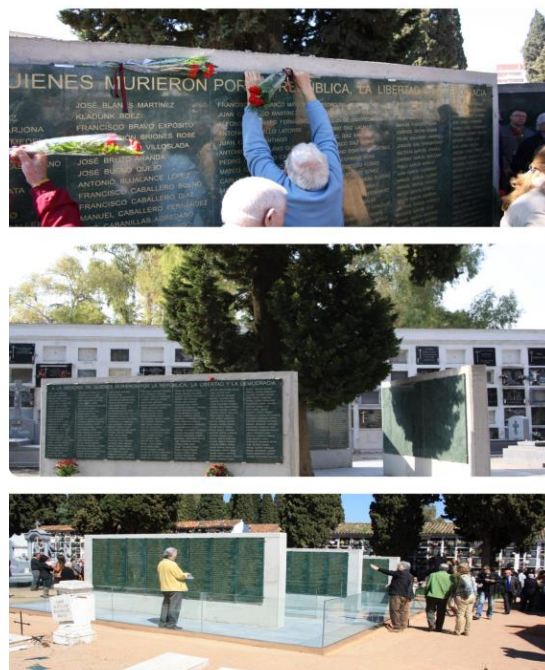
Fig. 3.1 Muros de la Memoria cementerios La Salud y San Rafael

Estos “ Muros de la Memoria ” rescatan del olvido y presentan a la ciudadanía cordobesa, más de 2000 nombres de hombres y mujeres que fueron fusilados sin juicio previo o tras una parodia de juicio sumarísimo, a partir del triunfo en la capital cordobesa del golpe militar del 18 de julio de 1936.