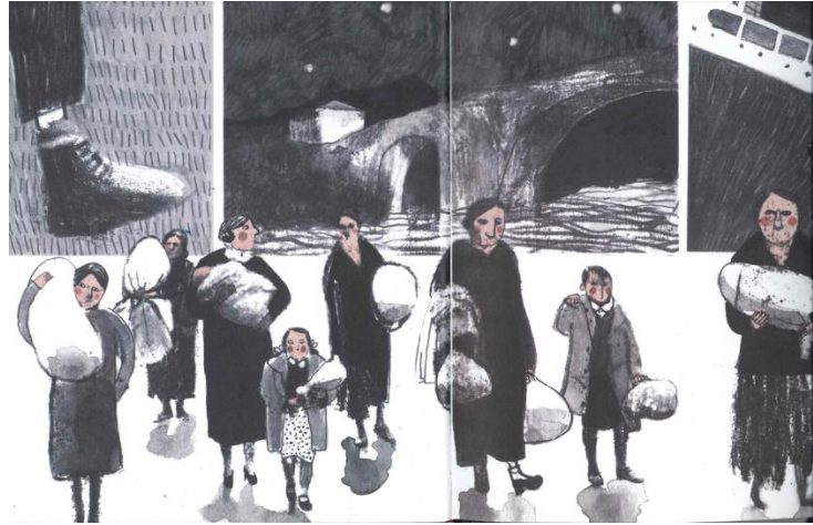
Imagen 2. Escena de Mexique. El nombre del barco , basada en una fotografía histórica de mujeres y niños huyendo hacia Bizkaia en 1936.