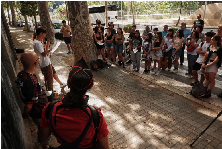
Inauguración y conmemoración del Mural de homenaje al paso de las Brigadas Internacionales por Barcelona