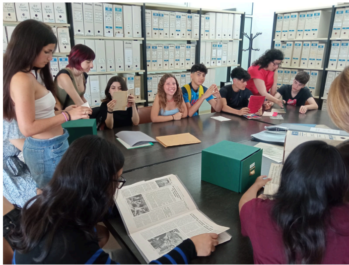
El alumnado analizando fuentes primarias en la Biblioteca del Pavelló de la República